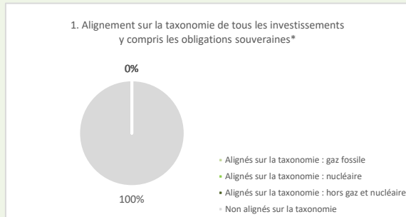
Ce graphique représente % des investissements totaux

Les deux graphiques ci-dessous font apparaître en vert le pourcentage minimal d'investissements alignés sur la taxonomie de l'UE. Étant donné qu'il n'existe pas de méthodologie appropriée pour déterminer l'alignement des obligations souveraines* sur la taxonomie, le premier graphique montre l'alignement sur la taxonomie par rapport à tous les investissements du produit financier, y compris les obligations souveraines. Le deuxième graphique représente l'alignement sur la taxonomie uniquement par rapport aux investissements du produit financier autres que les obligations souveraines.