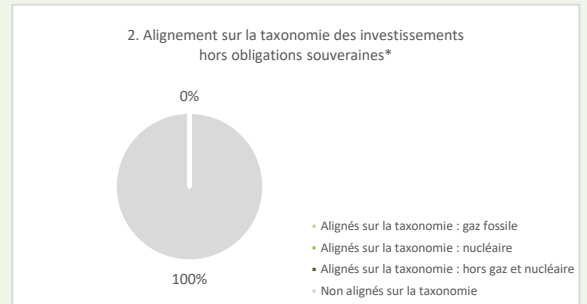
Ce graphique représente 75% des investissements totaux

* Aux fins de ces graphiques, les « obligations souveraines » comprennent toutes les expositions souveraines.