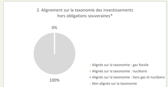
Ce graphique représente 62% des investissements totaux

* Aux fins de ces graphiques, les « obligations souveraines » comprennent toutes les expositions souveraines.