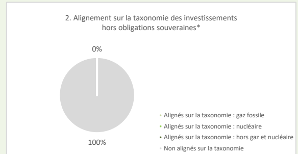
Ce graphique représente 100% des investissements totaux

* Aux fins de ces graphiques, les « obligations souveraines » comprennent toutes les expositions souveraines.