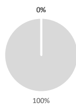
1. Alignement sur la taxonomie de tous les investissements y compris les obligations souveraines*

Les deux graphiques ci-dessous font apparaître en vert le pourcentage minimal d'investissements alignés sur la taxonomie de l'UE. Étant donné qu'il n'existe pas de méthodologie appropriée pour déterminer l'alignement des obligations souveraines* sur la taxonomie, le premier graphique montre l'alignement sur la taxonomie par rapport à tous les investissements du produit financier, y compris les obligations souveraines, tandis que le deuxième graphique représente l'alignement sur la taxonomie uniquement par rapport aux investissements du produit financier autres que les obligations souveraines.