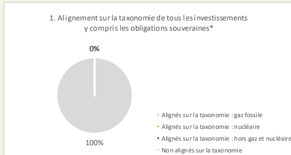
Ce graphique représente % des investissements totaux

Les deux graphiques ci-dessous font apparaître en vert le pourcentage minimal d'investissements alignés sur la taxonomie de l'UE. Étant donné qu'il n'existe pas de méthodologie appropriée pour déterminer l'alignement des obligations souveraines* sur la taxonomie, le premier graphique montre l'alignement sur la taxonomie par rapport à tous les investissements du produit financier, y compris les obligations souveraines. Le deuxième graphique représente l'alignement sur la taxonomie uniquement par rapport aux investissements du produit financier autres que les obligations souveraines.